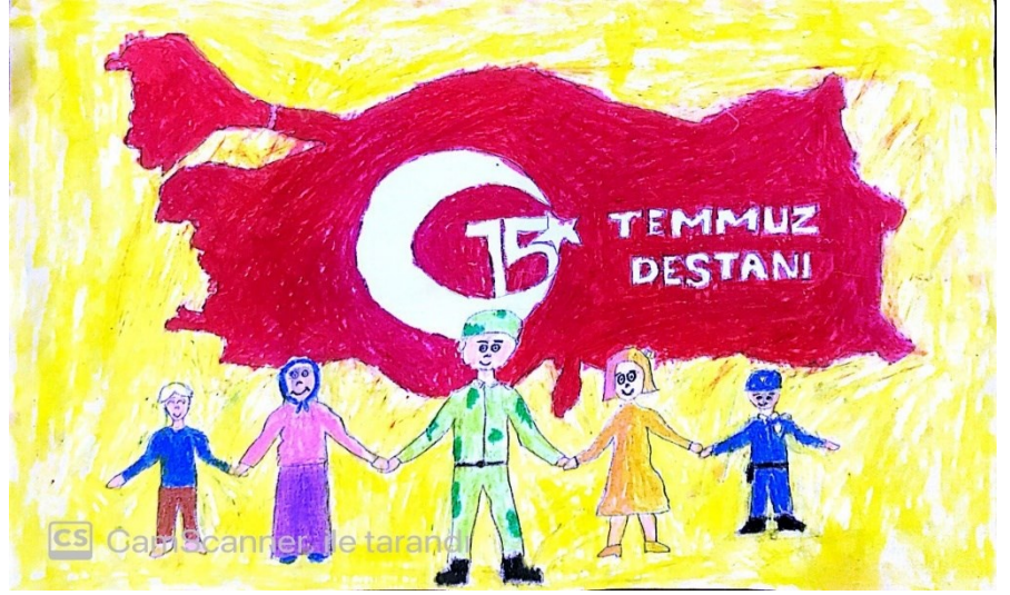
Resim yarışması 3. sù Melisa KESKİN – 2/C