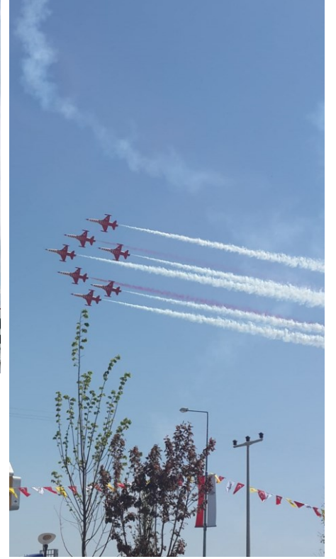
Nehir ZENCİR – 2/E