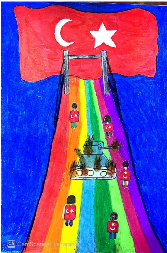
Resim Yarışması 1.si İpek ÇETİN- 4/E

Çocuklarım ve bu aziz vatan sizlere emanettir.