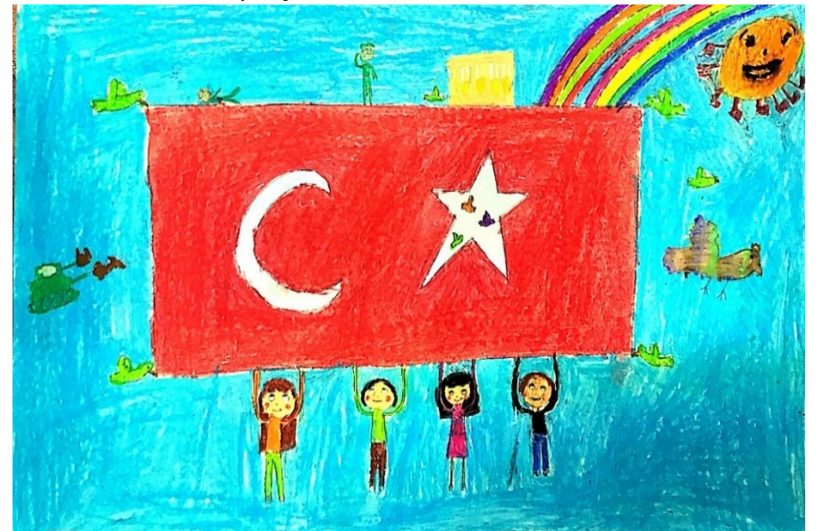
Resim yarışması 2. si Sila Besa YUMAK – 4/G