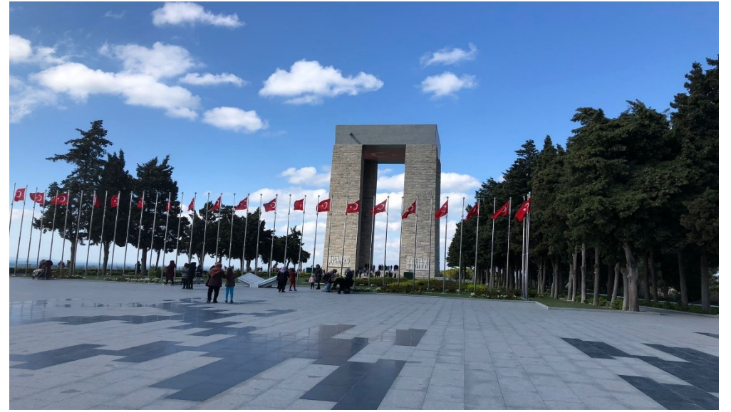
Eren ÇELİK – 3/D